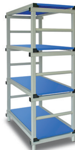
Estantería con baldas lisas.