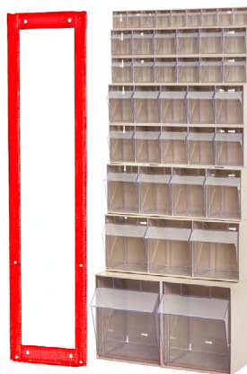
» Soporte pared