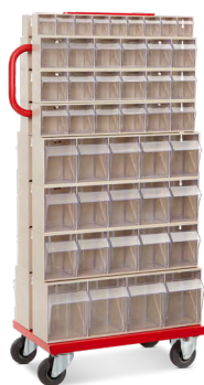
» Soporte carro