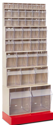
» Soporte expositor