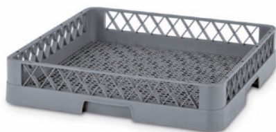
9100 | BANDEJA RACK SIMPLE

Dimensiones Ext. L.500; A.500; h.102 mm. Alt. Apilada 94 mm. Abertura Red 98 mm. Peso 1,220 kg. Color Ud. Palet 100