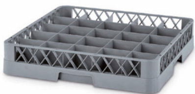
9125 | BANDEJA RACK 25 COMPARTIMENTOS

Dimensiones Ext. L.500; A.500; h.40 mm. Incremento Altura 40 mm. Peso 0,460 kg. Ud. Palet 200 Color Ud. Palet 80