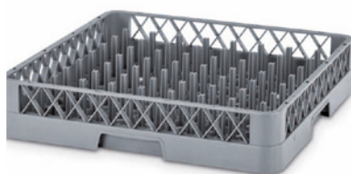
9101 | BANDEJA RACK PARA PLATOS

Dimensiones Ext. L.500; A.500; h.102 mm. Alt. Apilada 94 mm. Abertura Red 98 mm. Peso 1,220 kg. Color Ud. Palet 100