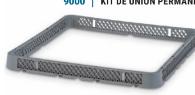
9200 | EXTENSIÓN RACK SIMPLE

Dimensiones Ext. L.500; A.500; h.102 mm. Alt. Apilada 94 mm. Cap. Platos 18 Peso 1,300 kg. Color Ud. Palet 100